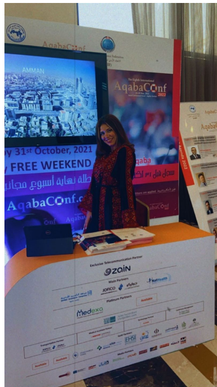
جناح مؤتمر العقبة في ملتقى شرم الشيخ

الاقتصادية الخاصة، والتاريخ من 15 إلى 19 أيار 2022، وذلك بتنظيم وتعاون مشترك بين الاتحاد الأردني لشركات التأمين وبين الـ GAIF، وقد نُشرت الرسالة في الموقع الرسمي للمؤتمر www.aqabaconf.com الذي يتضمّن التفاصيل كاملة. ثم توالى المفاجآت وأهمّها اثنتان، الأولى مُنح إقامة مجانيةّ لمدةً ليلتين للمشاركين في حال سجّلوا أسماءهم لحضور المؤتمر قبل 2021/10/31. أما الثانية فتمثّلت بإعلان جديد أطلقته اللجنة التحضيرية ووزّع على المهتمّين والإعلاميين وقد تضمّن نوعاً من "النوستالجيا" الجميلة (استعادة الحنين) إذ ورد فيه: إنضمّوا إلينا وشاركونا فرحتنا لاستعادة الذكريات الاستثنائية، للمشاركة في اجتماعات ولقاءات فعّالة، ولحضور جلسات علمية مكثّفة. وتضمّن هذا الإعلان تفاصيل عن الويك أند المجاني، عنوان الموقع واللغو الجميل الذي يجمع صورة عن العقبة وشعاري الـ GAIF والاتحاد الأردني الراعيين هذا المؤتمر.