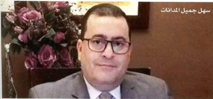
سهل جميل المدانات

وعليه يتوجب على كافة أصحاب المركبات الأردنية التي إنتهت وثائق تأمينها خلال فترة الحظر مراجعة أقرب مركز ترخيص للمركبات في مناطقهم لتجديد ترخيص المركبات والحصول على وثيقة تأمين إلزامي من المكتب الموحد للتأمين الإلزامي المتواجد في كافة مراكز التخصيص في مختلف محافظات الأردن، أو الحصول على وثيقة تأمين شامل من أي من شركات التأمين المجازة لممارسة تأمين المركبات تجنباً للتسبب بأي حادث مروري، وهو الأمر الذي يعرضهم لتحمل تكاليف كافة الأضرار التي تسببها مركباتهم للغير سواء كانت وفيات أو إصابات جسمية أو أضرار مادية كون مركباتهم إنتهى تأمينها مما يعني قانوناً عدم وجود شركة تأمين لتحمل محلهم في دفع قيمة هذه الأضرار كونها غير مؤمنة.