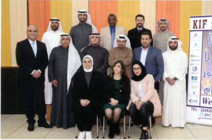
المشاركون في برنامج تدريبي في الكويت