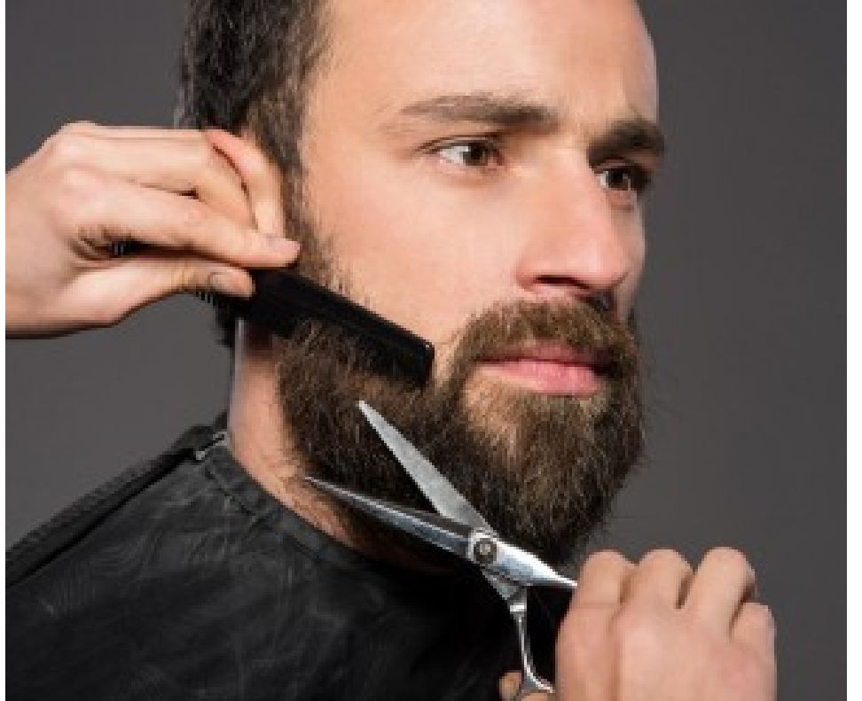
شعر لحية كثيف كالأتراك

يشار إلى أن العديد من المركبات تعرضت لحالات "شبه غرق" في عدد من مناطق المملكة خاصة في منطقتي الدوار السابع ووسط البلد في العاصمة عمان خلال المنخفض الأخير..