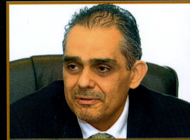
اللجنة الفنية AWRIS